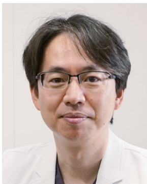
産科・婦人科 教授

特定機能病院として高度な医療を提供するため、各診療科と連携をとりながら、「最後の砦」となる救急医療を提供できる体制を強化していきたいと思っております。また、熊本県全域では、救急専門医が少ない状態のため、救急救命センターとも協力を行い、大学病院で救急医の育成を行い、県内をカバーできる救急のネットワーク作りを努力して参ります。今後ともどうぞよろしくお願いいたします。