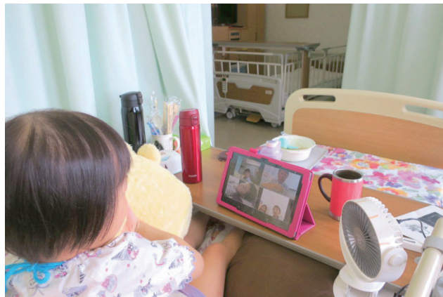
【写真】 オンライン授業「英語であそぼう」の様子①

コロナの影響で熊大病院の院内学級の教室を一時閉鎖し、オンラインでの授業を続けていました。