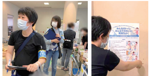
【写真】院外での感染対策活動の様子

感染対策は地域全体で考える時代です。私たちは、病院内での活動とともに、今後も地域の感染対策にも貢献していきます。