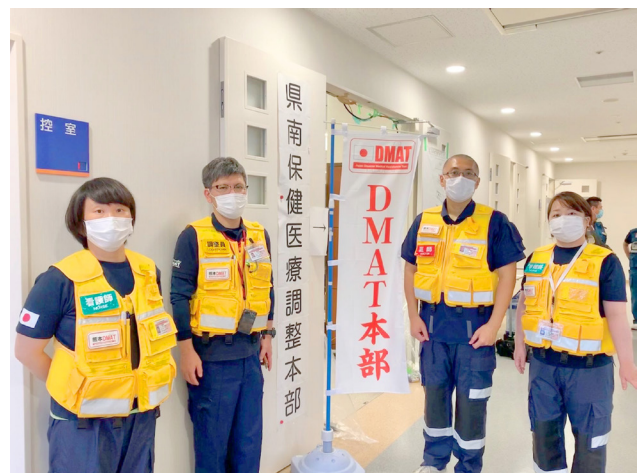
【写真】 災害派遣医療チーム(DMAT)本部(熊本労災病院)

県南保健医療調整本部の本部活動に参加しました。一方で人吉に派遣されたチームは人吉球磨医療圏保健医療調整本部の指示で人吉医療センターの救急外来の診療をサポートしました。人吉医療センターの診療機能をサポートするため、救急外来への支援として救急・総合診療部および消化器外科から計3名の医師が派遣され、さらに周産期医療の支援として産科婦人科の医師2名が派遣されました。また、熊本県看護協会からの要請で被災地の病院や避難所に計6名の看護師が派遣されるとともに、避難所の感染対策をサポートするため、感染制御部の看護師2名が被災地の避難所に派遣されました。その他にも糖尿病、神経疾患、循環器疾患などの専門診療に関して電話相談窓口の開設などの情報提供のサポートも行われました。