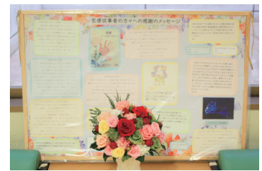
【写真】 医療従事者に対する応援の品々