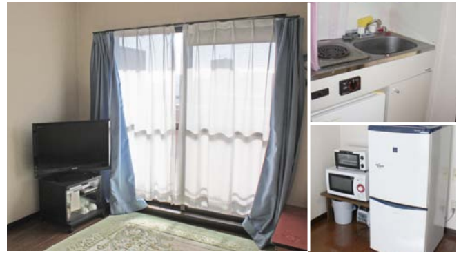
【1号館】 1泊(お一人)1,000円 1R(6畳洋室) 徒歩約7分 設備:寝具・テレビ・調理器具・冷蔵庫・電子レンジ・炊飯器など

入院する子どもやその家族の精神的、経済的負担は、とても大きなものです。低料金で安心してくつろげる場所が病院の近くにあれば、家族の負担は軽減できます。たんぽぽハウスはそんな子どもたちや家族をサポートするために、現在ボランティアによって運営されています。