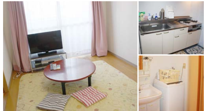
【2号館】 1泊(お一人)1,500円 1LDK(8畳LDK+4畳洋室) 徒歩約7分 設備:寝具・テレビ・調理器具・冷蔵庫・電子レンジ・炊飯器・洗濯機など