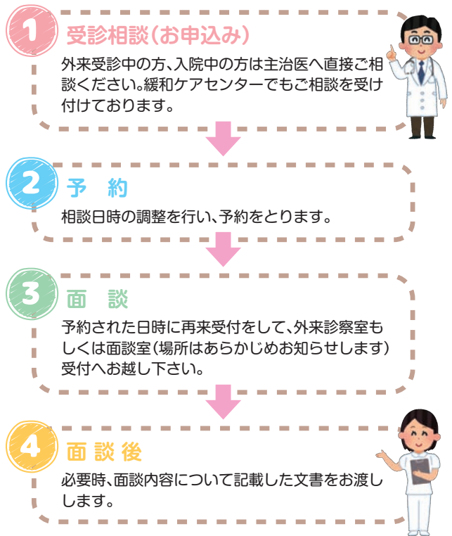
図1 「がん看護外来」ご利用について

【対象となる方】 本院に通院されている患者様及びそのご家族 【実施日時】 平日9:00～16:00(祝祭日を除く)※完全予約制 【場 所】 外来診察室もしくは面談室(場所はあらかじめお知らせいたします)