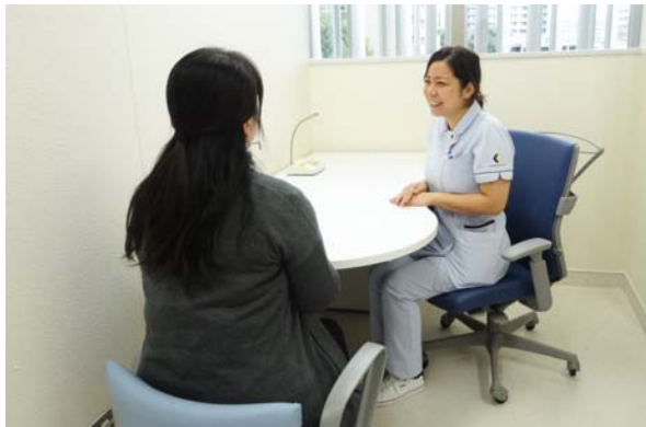
【写真】 個室での面談の様子

がん看護外来では、がん治療や療養に伴う身体症状の緩和や対処、お気持ちのつらさや不安に対して、個室での面談という方法で、お話を伺いながら支援をしています。「がんと診断され、今後のことを考えて不安になった」「治療中の副作用や具体的な対応について聞きたい」「痛みが辛いので、どのように対応したらいいかわからない」「誰かにこの気持ちを聞いてほしい」等、多岐にわたる相談に対し、少しでも不安な気持ちや心配なことが緩和されるように一緒に考え、対応させて頂いています。