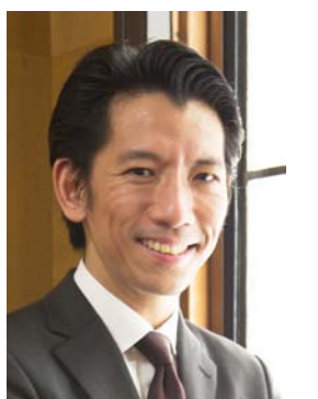
小児外科・移植外科 教授

私自身は東京育ちですが、母の故郷であります九州の地域医療にぜひとも貢献したいと思っております。皆様どうぞ宜しくお願いいたします。