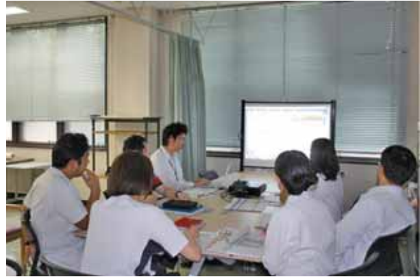
研究支援に関する打ち合わせ